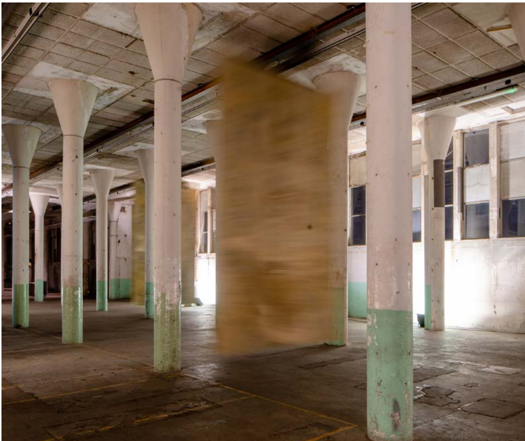
Still live - Ronald Rietveld