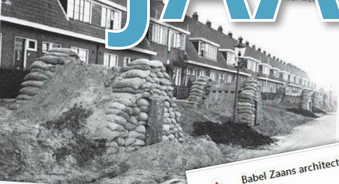
Woensdag 13 november: Behoud of sloop? Tweede Wereldoorlog: de cultuurhistorische waardering van woningbouw in de Zaanse Schied